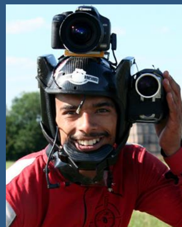
Un caméraman suit votre saut